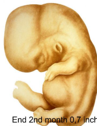
End 2nd month 0,7 inch (17,5 mm) Bleichschmidt Collection