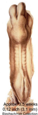
Approx. 3,5 weeks 0,12 inch (3,1 mm) Bleichschmidt Collection