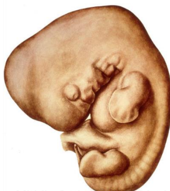
Middle 2nd month 0,4 inch (10 mm) Bleichschmidt Collection